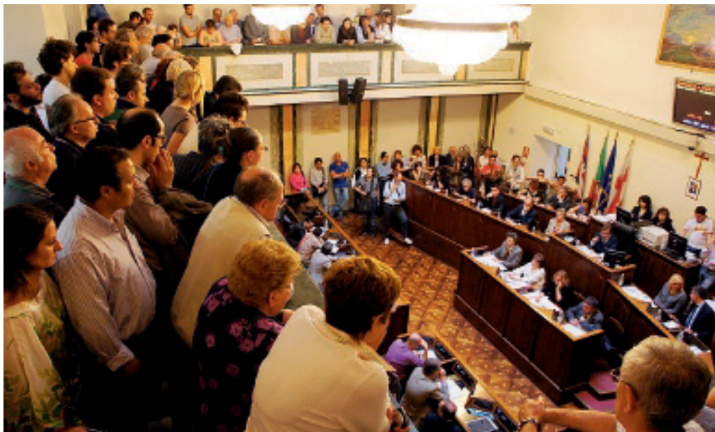
Balconata piena di pubblico, cinque anni fa, per il primo consiglio comunale della giunta Rossa

2 Le modalità per inviare le domande per i candidati