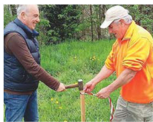
Organizzatori al lavoro per la preparazione del percorso

■ Un trail e una camminata a scopo benefico, in uno scenario spettacolare. Ad Altavilla Monferrato, domenica 10 aprile. Con partenza alle 9.30. E quasi tutto pronto per il primo trail della zona: Valle Rio Trail prevede un percorso di 20 chilometri, e uno di 10 da affrontare di corsa e camminando (disponibile la pagina facebook dell'evento: Valle Rio Trail). Al termine, premiazioni e pasta party. Previsto servizio fotografico e cronometraggio. La manifestazione è organizzata dall'associazione Stella Bianca Laura Garavelli, dal Comune di Altavilla, con la collaborazione della Cfil, Polisportiva Cuccarese. «Abbiamo voluto proporre agli atleti, agli appassionati delle corse in mezzo alla natura - spiegano gli organizzatori - una corsa in una zona che offre davvero tutto sia dal punto di vista naturalistico che umano. Perché in tanti ci hanno aiutato in questa nuova avventura, a partire dal sindaco Massimo Arrobio che ha messo a disposizione le strutture del paese al fine di accogliere i visitatori nel miglior modo possibile. Si tratta di una manifestazione agonistica (Aics), ma che vedrà scendere in campo anche i camminatori. Il percorso breve, infatti, sarà a disposizione di chi ama passeggiare in mezzo alla natura. Tra vigne e boschetti, all'interno di uno scenario davvero suggestivo».