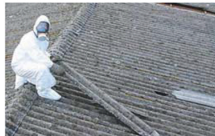
Amianto, bonifica complessa. A Mirabello la discarica?